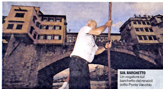
SUL BARCHETTO Un vogatore dei renaioli sotto Ponte Vecchio